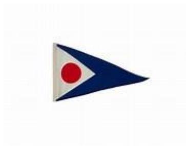
J S A Fクラブバース旗